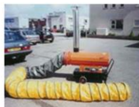
hete lucht kanon

Bijlage V; Toelichting en Veiligheidsplan: Reeds in bezit, niet ter publicatie